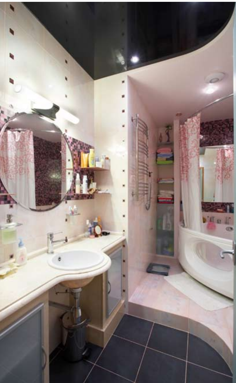
▲ Угловую ванну установили на подиум, выделив эту зону уровнем пола, цветом кафеля и фрагментом натяжного потолка

В основе декоративного решения интерьера – форма круга и морская тематика