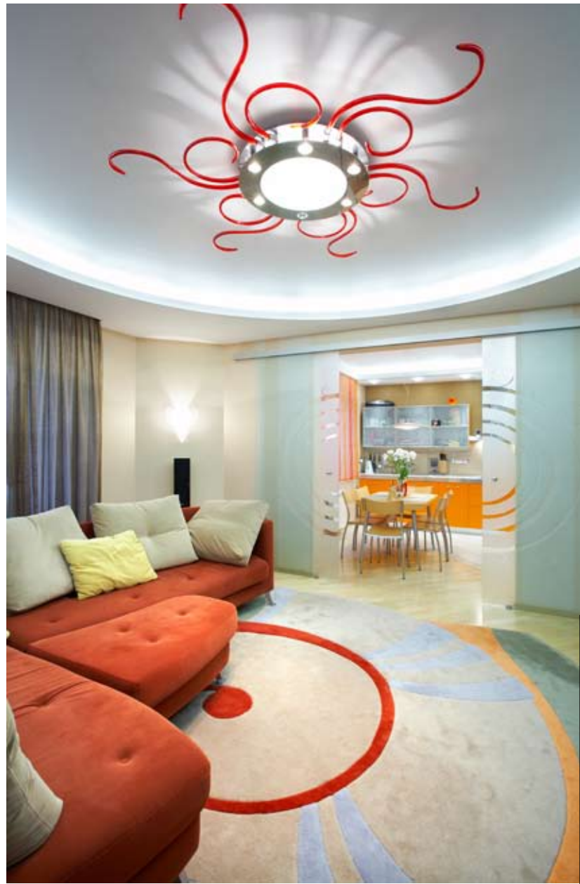
▲ Посреди потолка – люстра, завораживающая своим бионическим дизайном

в сложенном виде имеет почти прямоугольную форму, и за ним помещается шесть человек. Но столешница раскладывается, превращаясь в круг диаметром 2 м. Это очень удачная находка для гостеприимного дома. Проходная зона ведет мимо гостевого санузла в приватную половину. Спальня хозяев выполнена в терракотово-розовой гамме. Стены «одеты» в два вида контрастных однотонных обоев, при этом светлыми выделена ниша, организованная над изголовьем кровати, а также часть противоположной стены, у которой под круглым зеркалом установлен туалетный столик. Этот же принцип сочетания двух тонов